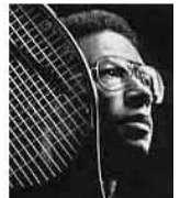
Arthur Ashe y el bailarín