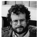
Randy Shilts, autor del libro "Y la banda siguió tocando".