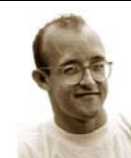
El artirta Geith Haring y