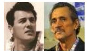
Muere Rock Hudson.