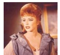
Muere la estrella Amanda Blake.