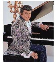
el pianista Liberace.