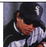
Muere Easy-E, estrella de rap "gangsta".

1996 Se aprueba en los Estados Unidos la venta de drogas para combatir el VIH: