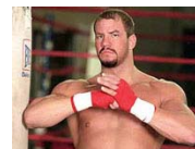
Tommy Morrison anuncia ser VIH positivo.