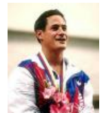
El clavadista y campeón olímpico, Grez Louganis, admite públicamente que tiene SIDA.